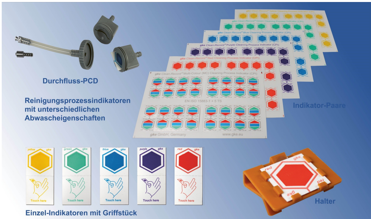
Abb 1: Indikatoren mit Halter und Durchfluss-PCD